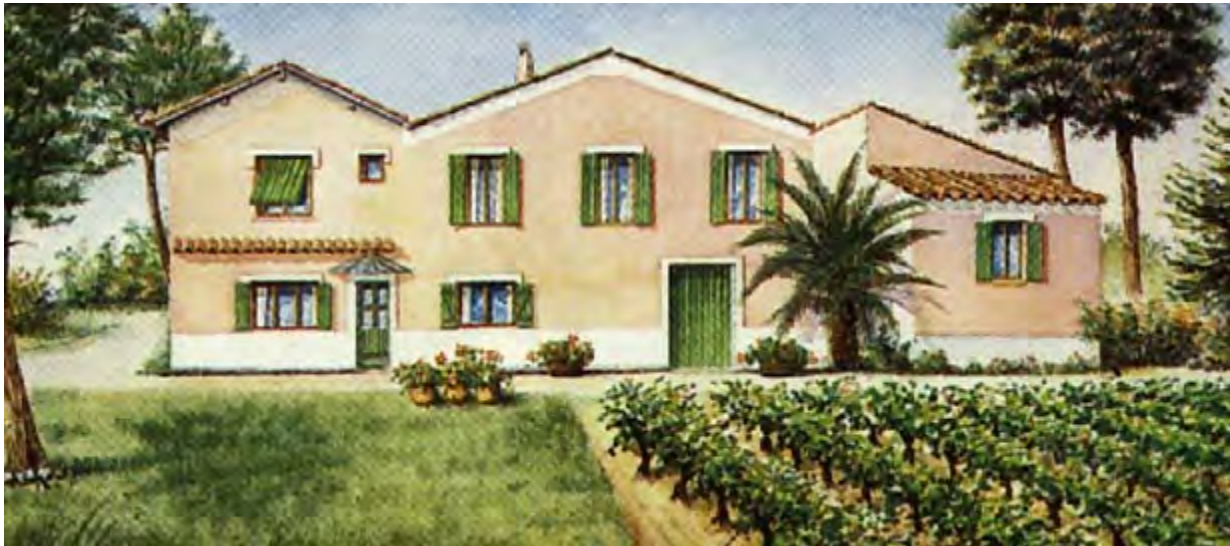
Roland Tarroux, Mas Saint-Laurent