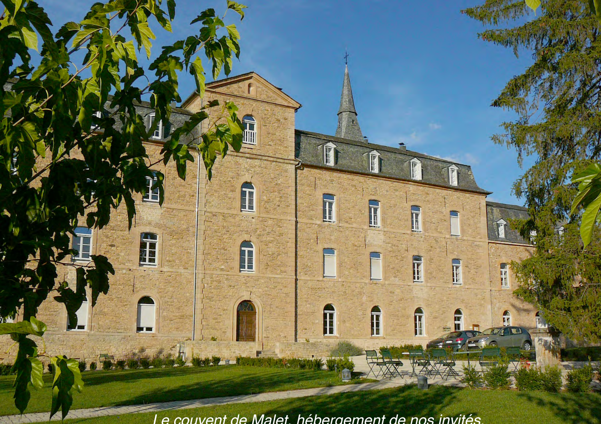
Le couvent de Malet, hébergement de nos invités, dont l'amphithéâtre accueille nos Rencontres