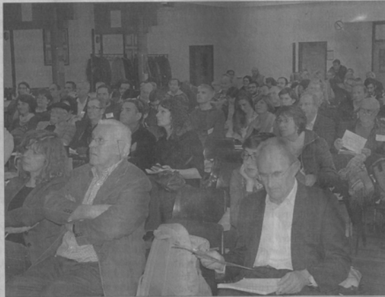
Quelque 150 personnes ont assisté durant deux jours aux différentes sessions.